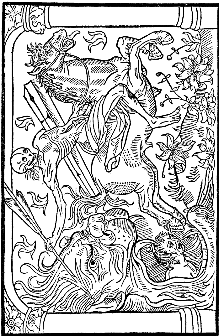
L'apocalypse selon Saint-Jean

Le Grand kalendrier et compost des Bergiers avecq leur Astrologie, etc., 1491.